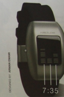
DESIGNED BY ARMAN EMAMI