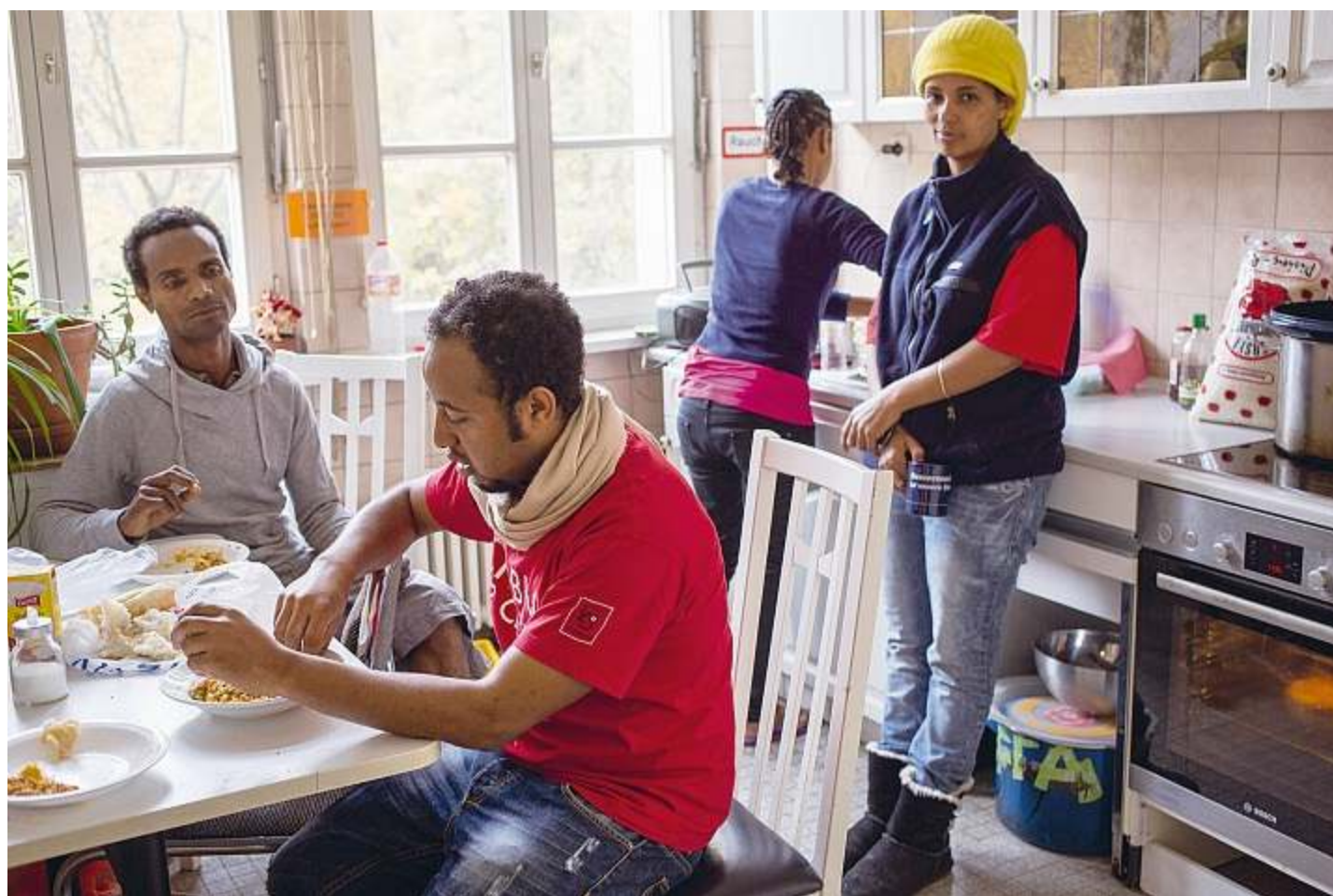
Vorübergehend im Warmen: Flüchtlinge in einem Gebäude der Heilig-Kreuz-Kirche Ende Oktober

Typ Alt-68er, der Anzüge auf unverkrampte Art und Weise tragen kann. Pfarrer wurde er damals, weil er gesellschaftliche Missstände angehen wollte.